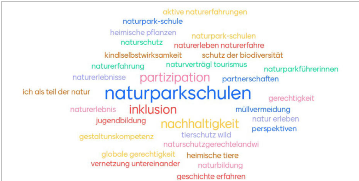
Abbildung 1: Antworten der Teilnehmer:innen auf die Frage „Was sind Ihre drei wichtigsten BNE-Themen im Naturpark Lahn-Dill-Bergland?“ (Mentimeter)