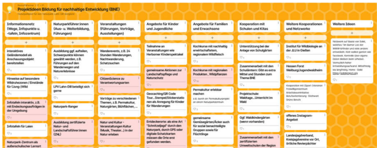
Abbildung 3: Ausschnitt der „digitalen Pinnwand“ (Padlet) zu Projektideen nach Bewertung durch die Workshop-Teilnehmer:innen

In der zweiten Arbeitsphase gelangen die Teilnehmer:innen auf ein zweite „digitale Pinnwand“ mit Projektideen für den Bereich BNE (siehe Abbildung 3). Nach einer Vorstellung der bereits vorhandenen Ideen können die Teilnehmer:innen Projektideen ergänzen. Nachdem zahlreiche Projektideen hinzugekommen sind, wird eine Bewertungsoption freigeschaltet, sodass die Teilnehmer:innen ihre „Herzensprojekte“ markieren können. Das heißt, die Teilnehmer:innen haben die Möglichkeit, je ein Herz pro „Karte“ zu vergeben. Für die Auswertung werden die Herzen pro Projektidee aufsummiert.